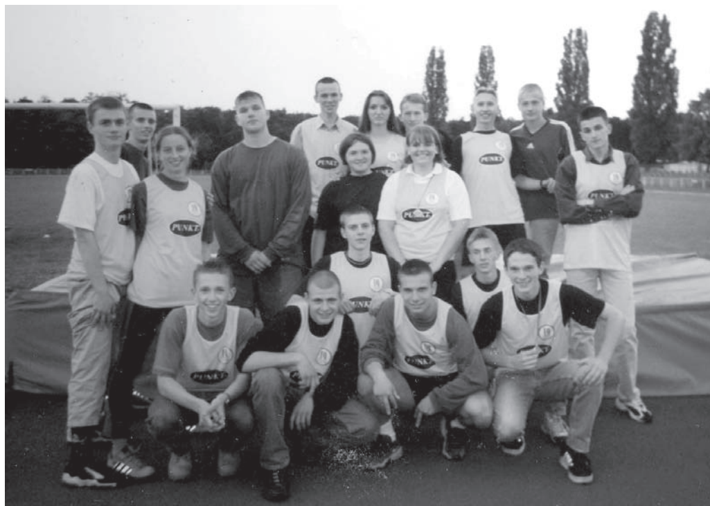
Zielona Góra, 2000 r. Wojewódzka Liga Lekkoatletyczna o Puchar Kuratora.