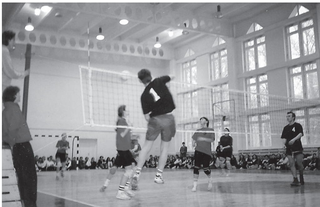
Rok 1994. Pierwszy mecz w nowej hali sportowej.