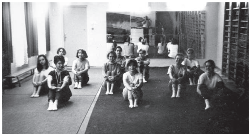
Lekcje wychowania fizycznego w latach 80-tych.