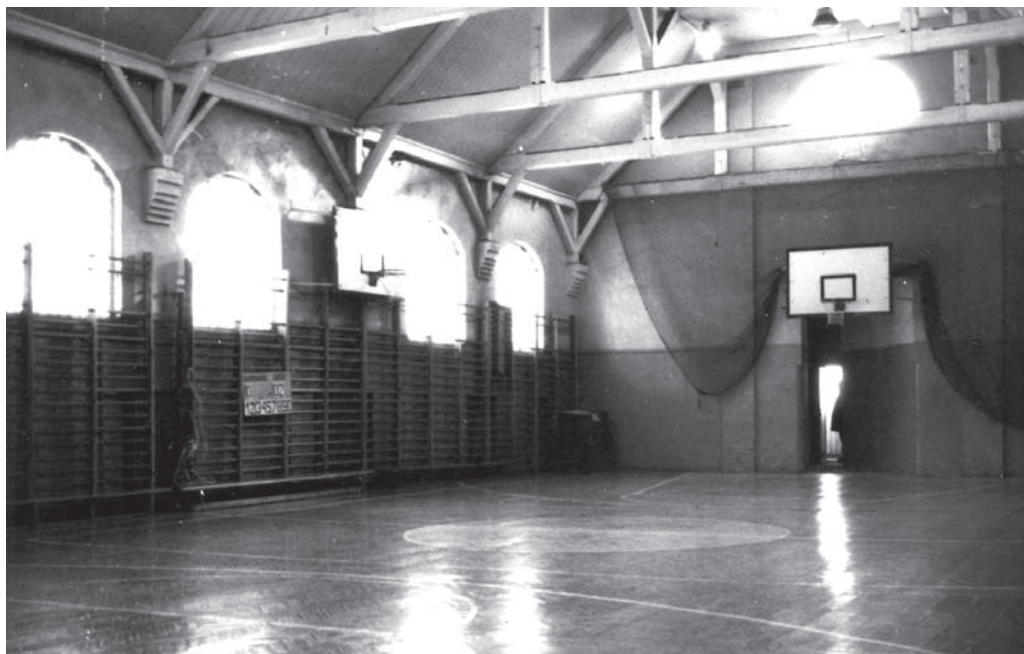
Widok „starej” sali gimnastycznej z 1983 roku.